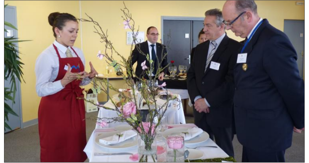
Ambiance printanière pour cette "table du 1 er avril".