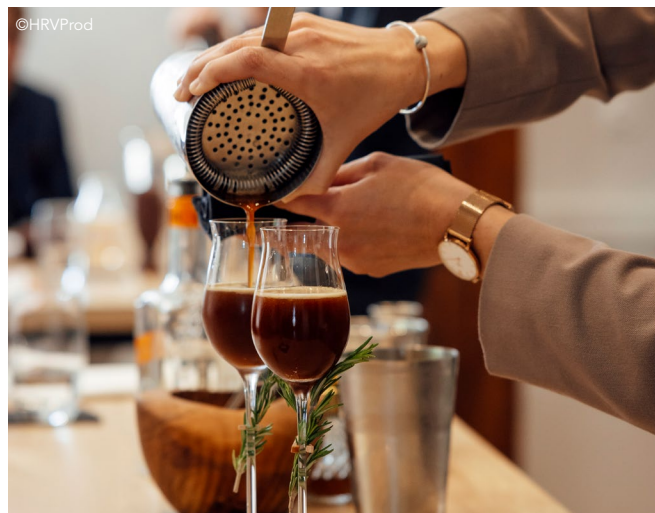
La réalisation des quatre ateliers n'aurait pas été possible sans le précieux soutien des partenaires du Trophée du Maître d'Hôtel.